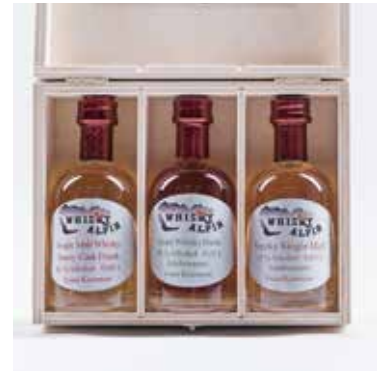
Geschenksboxen: Preise nach individueller Zusammenstellung